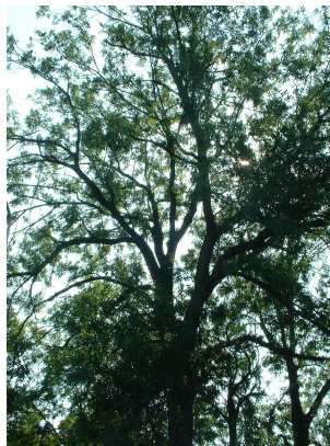
, 04 Août 2003